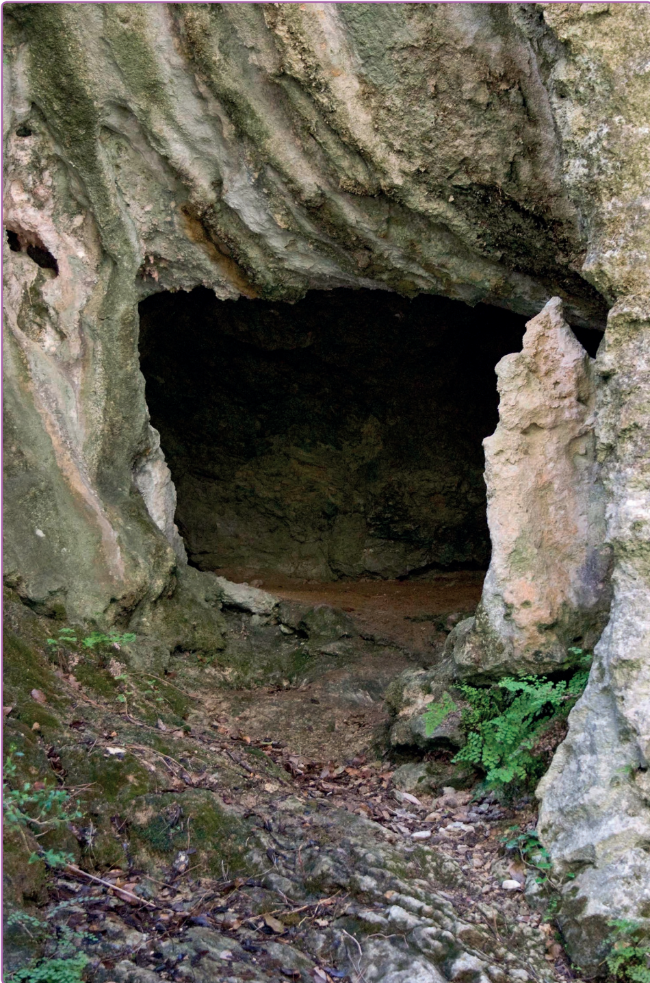
Tinença de Benifassà (Castelló)