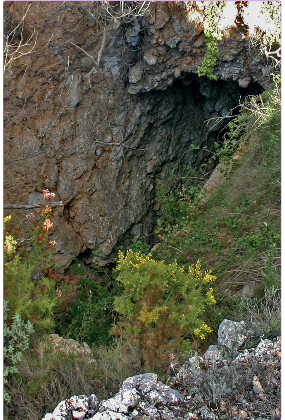
Serra de Chiva (València)