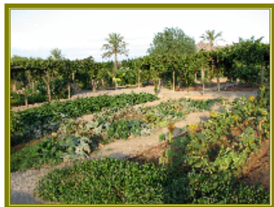
Aspecte parcial de l'Hort.

Tot el conjunt està envoltat per una franja de bardisses compostes per espècies tradicionals com els magraners, la murta o els rosers, que fan de barrera natural enfront del vent i les plagues, i en la orientació sud, la bardissa es diversifica i eixampla amb arbres i arbusts de diferent port conformant una espessa vegetació que alberga la fauna útil (aus, amfibis, rèptils, insectes, etc.).