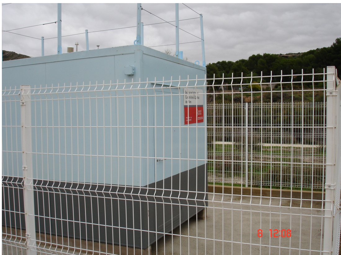
Foto: Estación de ELDA-LACY

También se lleva a cabo el análisis de metales como el Arsénico, Níquel, Cadmio y Plomo en la fracción PM_{10} , así como del benzo(a)pireno y otro hidrocarburos aromáticos policíclicos, con el fin de ir adaptando la red a las exigencias venideras a causa de la entrada en vigor de la normativa que regula los niveles de concentración de arsénico, cadmio, mercurio, níquel e hidrocarburos aromáticos policíclicos en el aire ambiente.