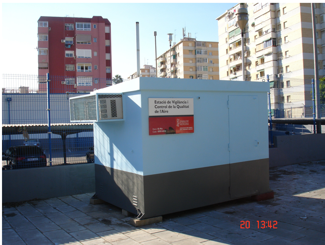
Foto: Estación de ALACANT-EL PLÀ

También se lleva a cabo el análisis de metales como el Arsénico, Níquel, Cadmio y Plomo en la fracción PM_{10} , así como del benzo(a)pireno y otros hidrocarburos aromáticos policíclicos, con el fin de ir adaptando la red a las exigencias venideras a causa de la entrada en vigor de la normativa que regula los niveles de concentración de arsénico, cadmio, mercurio, níquel e hidrocarburos aromáticos policíclicos en el aire ambiente.