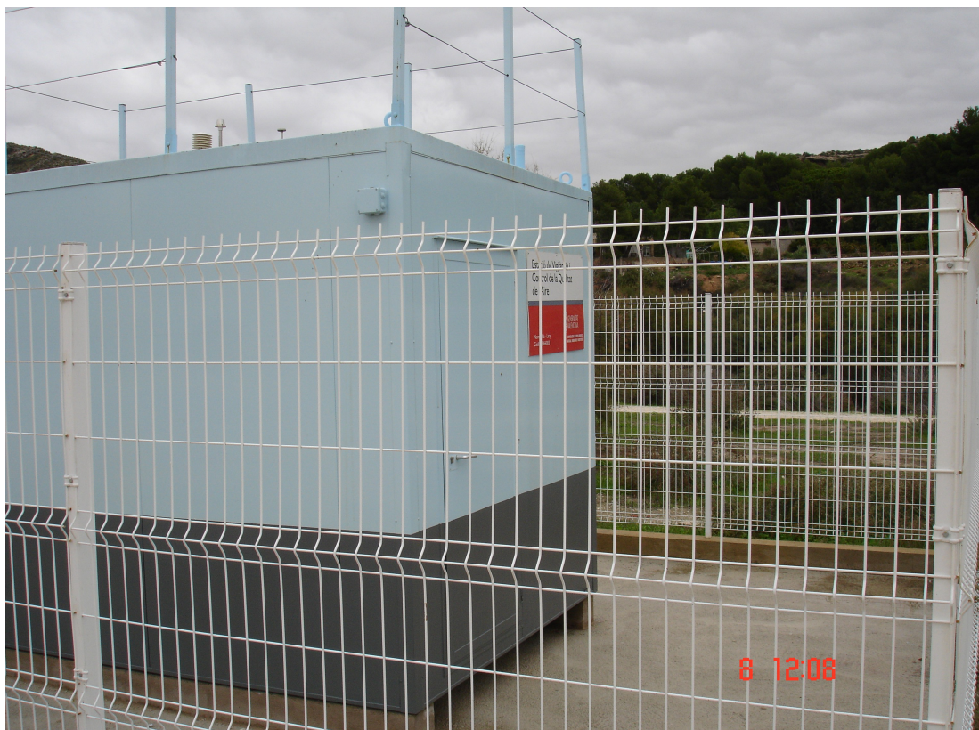
Foto: Estación de ELDA-LACY

También se lleva a cabo el análisis de metales como el Arsénico, Níquel, Cadmio y Plomo en la fracción PM 10 , así como del benzo(a)pireno y otro hidrocarburos aromáticos policíclicos, con el fin de ir adaptando la red a las exigencias venideras a causa de la entrada en vigor de la normativa que regula los niveles de concentración de arsénico, cadmio, mercurio, níquel e hidrocarburos aromáticos policíclicos en el aire ambiente.