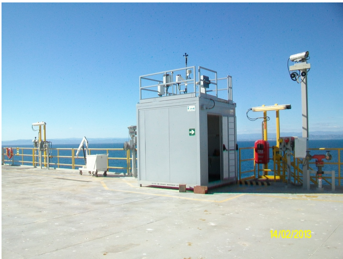
Foto: Estación de VINARÒS PLATAFORMA.

causa de la entrada en vigor de la normativa que regula los niveles de concentración de arsénico, cadmio, mercurio, níquel e hidrocarburos aromáticos policíclicos en el aire ambiente.